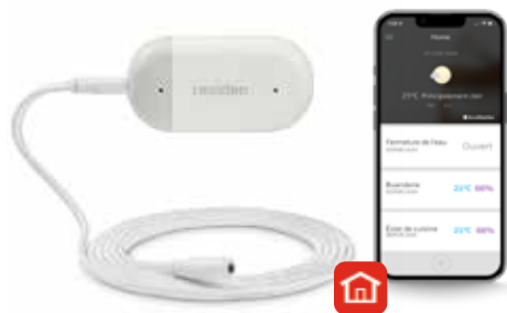
Braukmann L1 Détecteur de fuites d'eau et de gel WiFi

En travaillant ensemble, ces produits offrent aux clients une plus grande tranquillité d'esprit, en les alertant en cas de fuite ou de gel des tuyaux. De plus, la capacité de la vanne d'isolement réduit les dommages potentiels au sein du foyer. Le tout peut être géré sur un téléphone intelligent via l'application Resideo, ce qui en fait une solution incontournable pour les propriétaires d'aujourd'hui, férus de technologie.