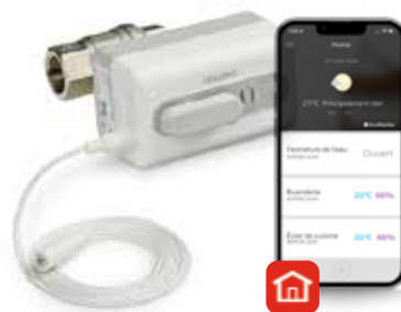
Braukmann L5 WiFi Vanne d'isolement des fuites d'eau